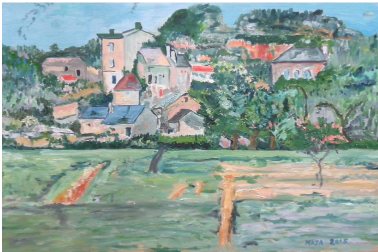
Naselje na brdu, 50x40 cm, ulje na platnu