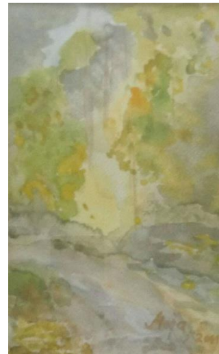
Šumski put, 15x24, akvarel