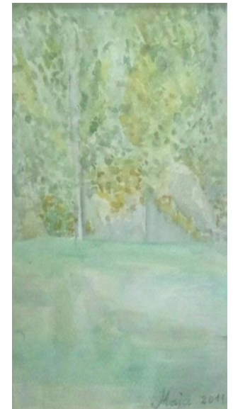
Zelena simfonija, 15x24cm, akvarel